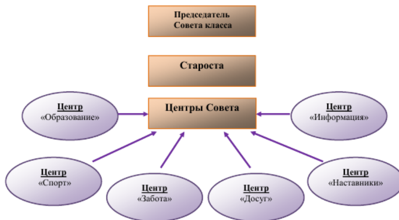
Структура школьного самоуправления